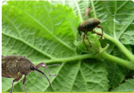
Fındık Kurdu ( Balaninus nucum )

141 g/l Thiamethoxam + 106 g/l Lambda-cyhalothrin etkili maddelerini içeren çok geniş etki alanlı bir insektisittir.